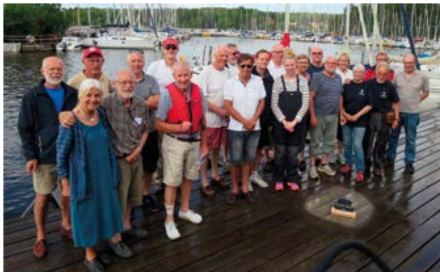
Text och foto: Tore Ericsson, 6-timmarskommittén