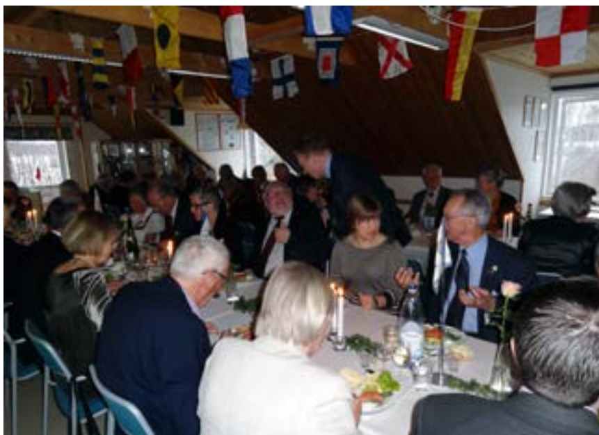
Ljudnivån fick signalfloggorna i taket att fladdra.