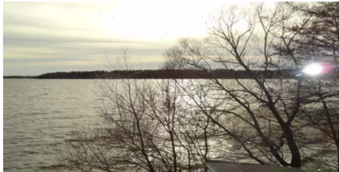
En strålande aprillkväll i en av Uppsalas bästa partylokaler – USS klubbhus på Skarholmen.