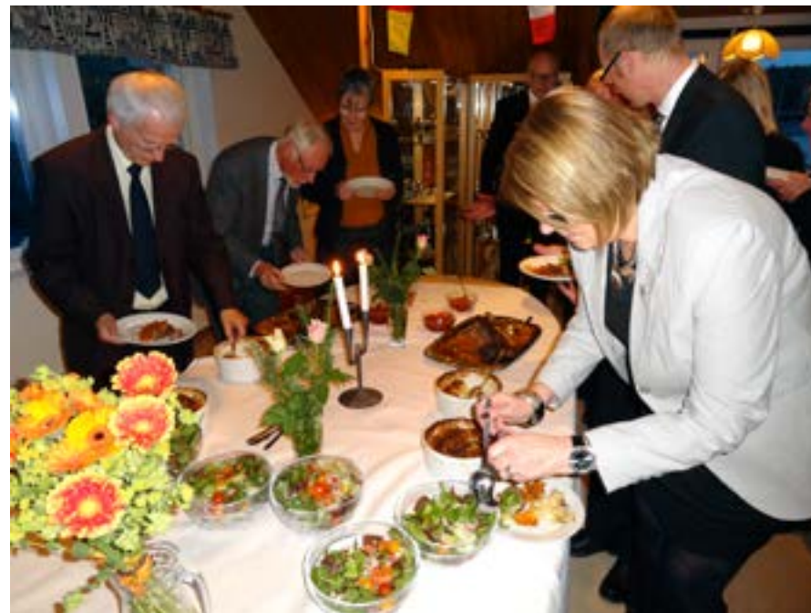
Varmrätten bestod av rådjursadel med tillbehör. Det fanns så att det räckte åt alla.