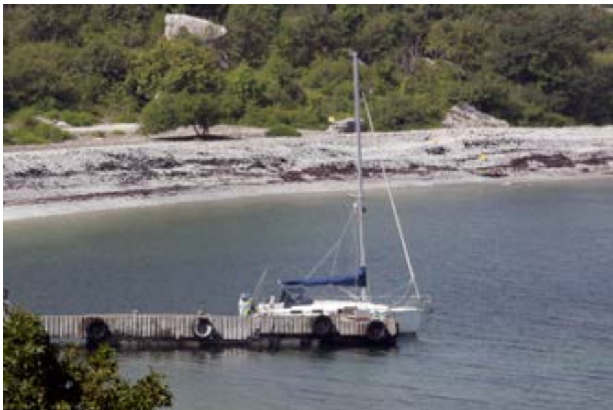
Vid bryggan på Stora Karlsö.

mycket kunnig. Vi såg fågelklipporna med tordmular och sillgrisslor. Vi såg enstaka ungar som ännu inte hade hoppat ner i havet. Vi såg får gå och beta. Vi såg fyren längst ut på en klippa.