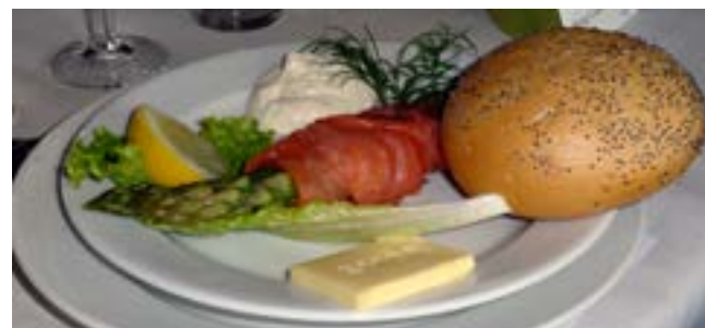
Lax och färsk sparris ställdes fram till förrätt.