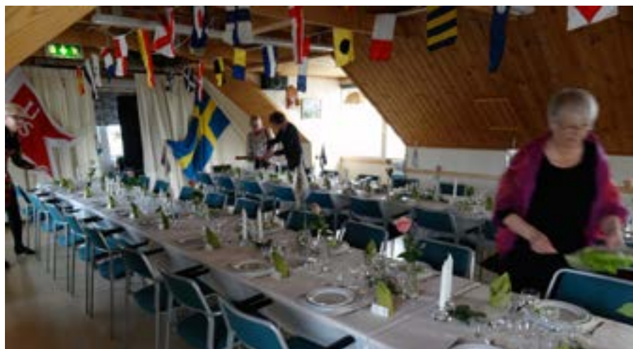
Snabb och effektivt dukades till middagen. I taket signalflaggor från början av 1900-talet, på borden Uppsalakretsens samling av vimplar.